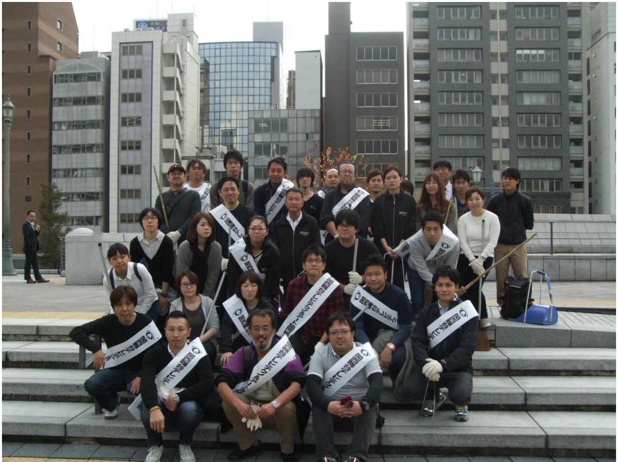
集合写真 青年部員とボランティア参加の皆様