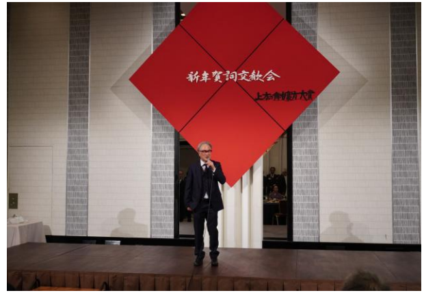
長尾副理事長の中締めのご挨拶